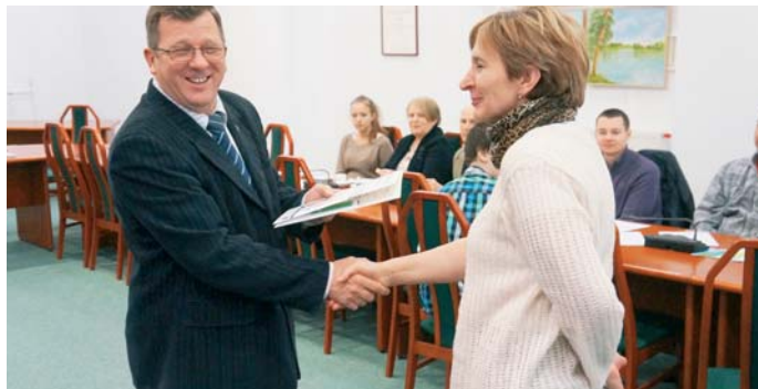
Konferencja zakończyła się wręczeniem certyfikatów i dyplomów uczestnikom projektu.

Działaniami z zakresu aktywnej integracji zostały objęte cztery grupy osób, z których największą liczbę stanowiły osoby niepełnosprawne. Wsparcie skierowane było też do rodzin zastępczych, wychowanków instytucjonalnej i rodzinnej pieczy zastępczej oraz usamodzielniających się wychowanków po