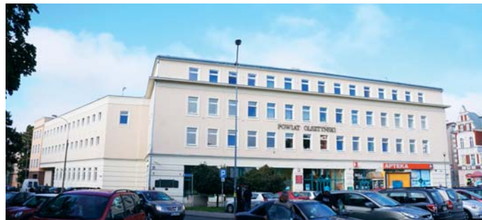
Powiat Olsztyński uplasował się na najwyższym miejscu wśród warmińsko-mazurskich samorządów biorących udział w rankingu Związku Powiatów Polskich

Samorządy oceniane są przez ekspertów ZPP