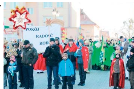
Barwny orszak Trzech Króli w Olsztynku tworzyły całe rodziny

We wtorek 6 stycznia, każdy mógł być królem – wystarczyło wyjść z domu, przysiąc na Orszak Trzech Króli, założyć koronę i razem z barwnym korowodem podążyć w kierunku betlejemskiej stajenki! Mimo mroźnej pogody, podobnie jak i w zeszłym, tak i w tym roku, ulicami Olsztyńska przeszedł Orszak Trzech Króli. Hasłem tegorocznego orszaku było wezwanie „Pokój – Radość – Rodzina”. Barwny korowód tworzyły więc całe rodziny.