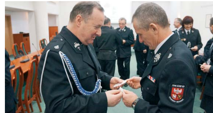
Po spotkaniu podsumowującym rok 2014 odbyła się strażacka wigilia

Jak co roku w grudniu strażacy ochotnicy z powiatu olsztyńskiego zebraли się na spotkaniu opłatkowym. Przed świąteczną uroczystością odbyło się posiedzenie Zarządu Oddziału Powiatowego Związku Ochotniczych Straży Pożarnych RP w Olsztynie. Strażacy podsumowali mijający rok i nakreślili plan pracy na rok 2015.