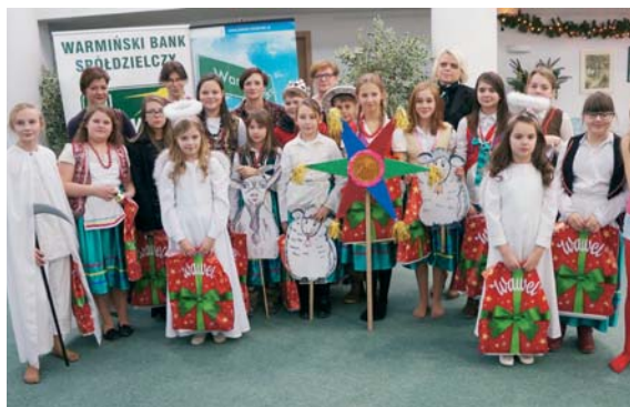
O artystyczno-świąteczną oprawę sesji podobały dzieci z Zespołu Szkolno-Przedszkolnego nr 1 ze Szkoły Podstawowej nr 2 w Biskupcu, które wystąpiły z jasełkami „Herody”

Drugim z konkursów był skierowany do gim-