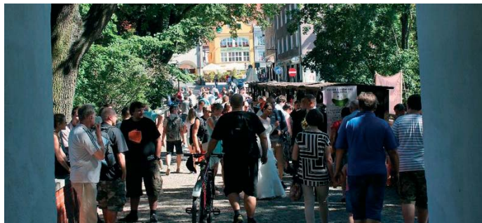
Organizatorzy liczą, że podobnie, jak w latach ubiegłych WFDB przyciągnie tysiące mieszkańców i turystów na poszczególnie odsłony wydarzenia w Biskupcu, Olsztynie i Braniewie

Objazdowe Muzeum Piwowarstwa, pokazy warzenia piwa „na żywo”, prelekcje historyczne, warsztaty sensoryczne, czy koncerty: Dezertera, Vavamuffin, Jamala, Sylwii Grzeszczak, Trubadurów, węgierskiego PASO, czy zespołu IRA – to tylko ułamek atrakcji III edycji Warmińskiego Festiwalu Dziedzictwa Browarniczego, który odbędzie się w lipcu i sierpniu w Biskupcu, Olsztynie i Braniewie.