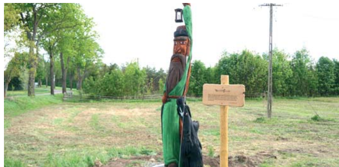
Przy drodze wjazdowej wita gości 4-metrowa rzeźba Smętka z kozą

Obecnie ścieżkę tworzą: Pęta Ostary – krótsza, dla młodszych dzieci i dłuższa – Pęta Leszego. Obie trasy dochodzą do jeziora, gdzie można zaobserwować aktywność bobrów. Poza tym na terenie znajdują się dwa place, na których można przeprowadzić lekcje leśne i zorganizować