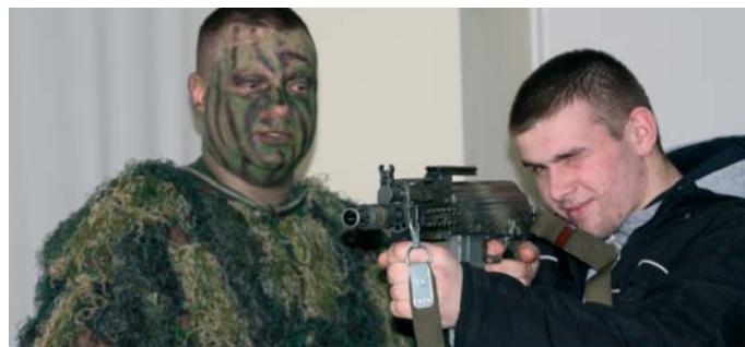
Uczniowie w czasie wizyty mogli wziąć udział m.in. w zajęciach ze strzelania

9 Warmiński Pułk Rozpoznawczy jest jednostką rozpoznawczą i żołnierze nazywani są tu „zwiadowcami”. Profesjonalizm szeregowych, podoficerów i oficerów budowany jest poprzez szkolenie w pułku i na kursach zewnętrznych, często zagranicznych. „Zwiadowcy” z Lidzbarka byli obecni na misjach zagranicznych. Kolejne zmiany zwiadowców zostały przygoto-