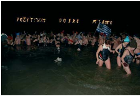
W nocnym morsowaniu nad jeziorem Limajno wzięło udział 258 osób