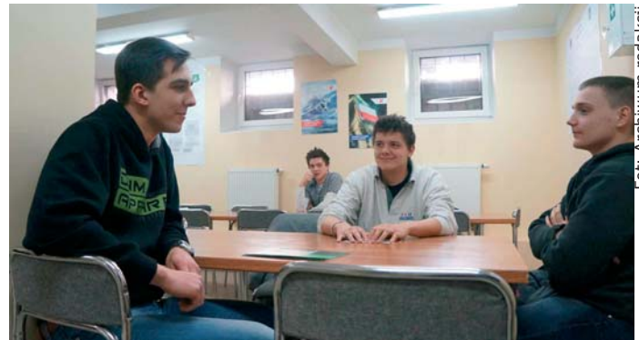
Kwalifikacja wojskowa w powiecie potrwa do 11 kwietnia. Przed komisją lekarską powinno się stawić 1009 osób.

Polskie Wojsko jest armią zawodową od 2010 roku. Od tego czasu nie ma już przymusowego poboru do wojska, jednak jest obowiązek stawienia się przed komisją kwalifikacyjną, która ma ocenić przydatność młodych mężczyzn i kobiet do służby czynnej i zawodowej. Przyczynienie konkretnej kategorii ma ułatwić pobór do wojska w przypadku wojny. Jest także potrzebna dla kandydatów do policji, straży pożarnej