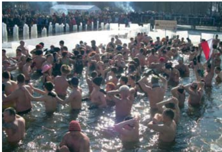
W Biskupcu kąpało się ponad 250 osób, a imprezę odwiedziło blisko 2 tysiące osób

Takich tłumów morsów i foczek jezioro Limajno jeszcze nie widziało! W drugiej nocnej kąpielii Pozytywnych (tak nazywa się klub morsów z Dobrego Miasta), która odbyła się 15 lutego wzięło udział aż 258 osób. To absolutny rekord! W wydarzeniu wzięły udział kluby morsów praktycznie z całego regionu: z Olsztyna, Lidzbarka Warmińskiego, Braniewa, Kętrzyna, Bartoszcza, Iławy, Ornety, Ostródy i Biskupca. Impreza się udała mimo braku mrozu, śniegu i padającego deszczu. Jeszcze większa frekwencja była na II Dadajowym Zlocie Morsów, który odbył się w niedzielę 23 lutego w Rukławkach w gminie Biskupiec. Liczba kąpiących się także przekroczyła 250 osób, a imprezę odwiedziło blisko 2 tysiące osób! Do Biskupca oprócz morsów i foczek z regionu przyjechali także morsy z Gdańska, Gdyni, Warszawy i Szczecina. Złot uświetniły dodatkowe atrakcje w tym m.in. bieg morsia, pokaz grupy freerunnerów Bc3Run, wystąpiła też Pracownia Tańca i Ognia Transfuzja, był pokaz ZUMBY, z quadami zaprezentowali się Motobracia, a nad głowami uczestników latał samolot, który zrobił zdjęcie z lotu ptaka. JaN