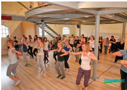
Zajęcia ruchowo-taneczne w Starej Gazowni cieszyły się dużym zainteresowaniem płci pięknej

W dniach 14 - 16 lutego miała miejsce akcja sportowo - rekreacyjna „Aktywny weekend w Dobrym Mieście”. Miłośnicy ruchu oraz zdrowego stylu życia mieli okazję skorzystać z bezpłatnych zajęć na siłowni, ścianie wspinaczkowej, zajęć spinningowych oraz tanecznych organizowanych w Strefie Fitness w Starej Gazowni. Imprezie towarzyszyły wykłady na temat zdrowego odżywiania i aktywności ruchowej oraz pokazy strongmenów, a także promocyjne ceny biletów i liczne atrakcje na Basenie „Na Fali”. CK Dobre Miasto