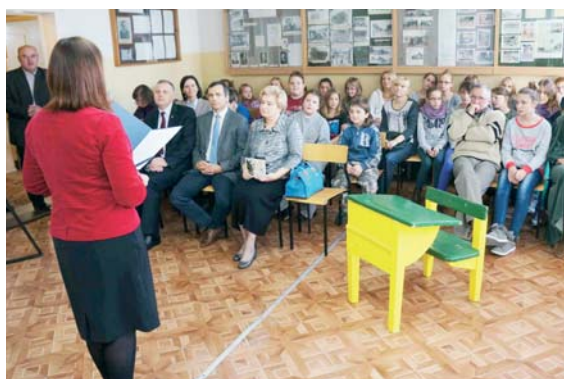
Wernisaż wystawy objazdowej o historii szkół polskich na Warmii i Mazurach zgromadził kilkadziesiąt osób