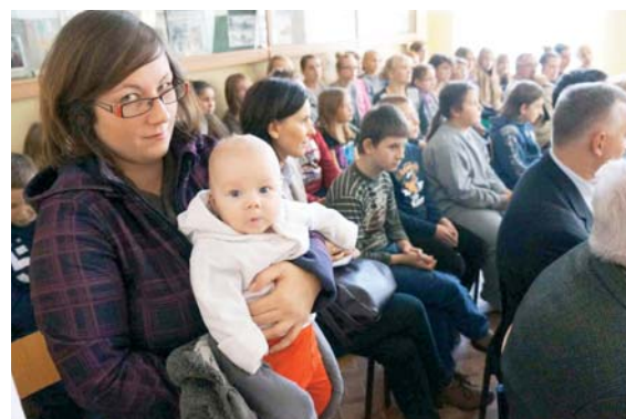
Mieszkanca Nowej Kaletki wspólnie z najmłodszym Warmiakiem, który odwiedził wystawę