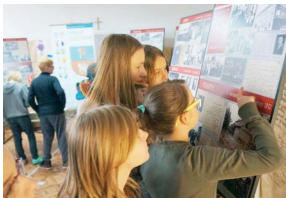
Młodzież z gminy Purda z ciekawością oglądała plan lekcji swoich poprzedników z przedwojennych szkół polskich