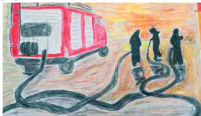
A tak prezentuje się jedna ze zwycięskich prac z ubiegłego roku

Oddział Powiatowy Związku Ochockiej Straży Pożarnej RP w Olsztynie zachęca do udziału w kolejnej edycji ogólnopolskiego konkursu plastycznego pod nazwą „Zapobiegajmy Pożarom”. Prace do oceny na etapie powiatowym należy przesyłać do 15 grudnia do olsztyńskiego starostwa.